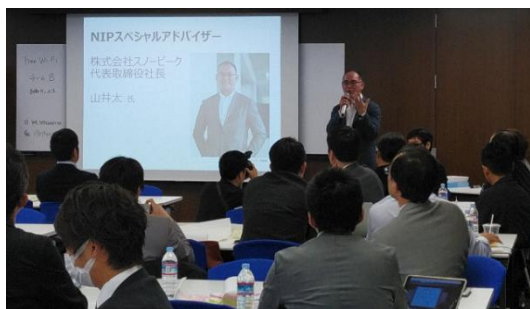
革新者の講演の様子