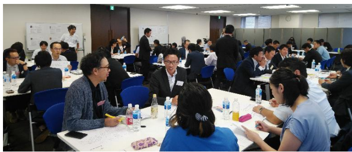
チーム毎に事業構想を練る参加者