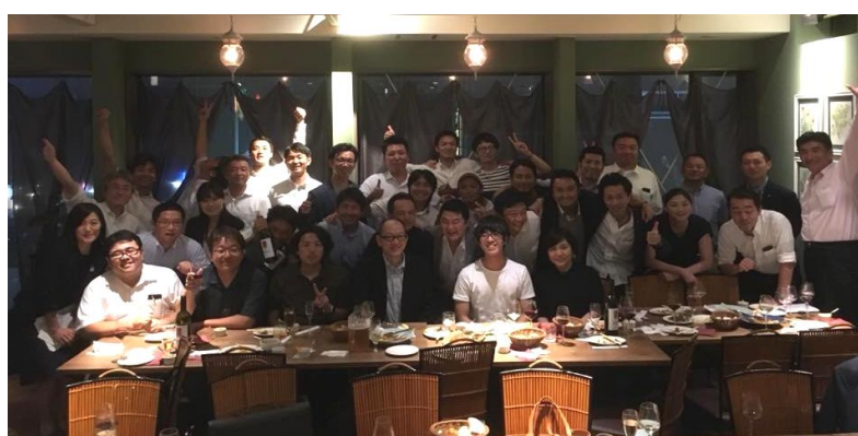
革新者との交流会