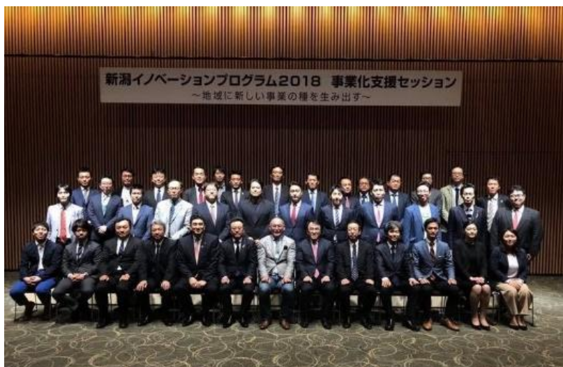
セッション終了後に参加者・クリエイターと