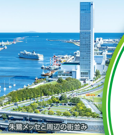
朱鷺メッセと周辺の街並み